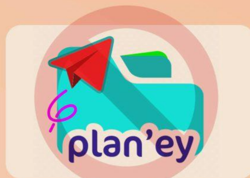
Changer les couleurs