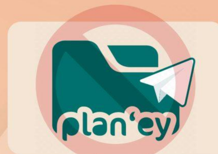
Changer un (ou plusieurs) élément(s)