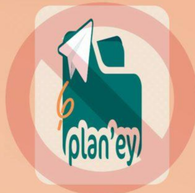
Changer le ratio

Ces cas d'utilisation non autorisés le sont aussi pour la version simplifiée.